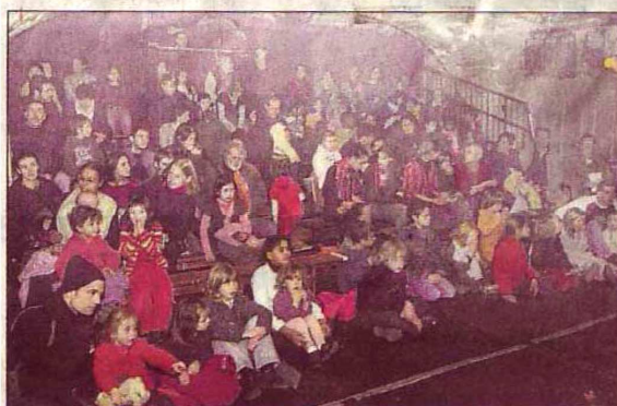
Petits et grands ont, semble-t-il, apprécié la performance.

► Une nouvelle séance est prévue cet après-midi à 16 heures. Attention, les places sont limitées.